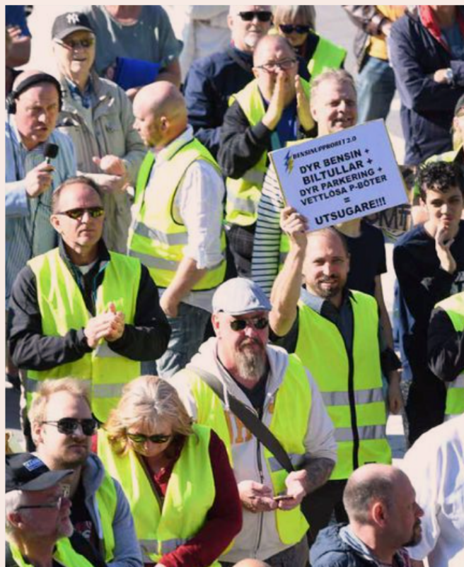
RÄTTVISEFRÅGA. Omställningen till grönare ekonomi möter motstånd, bland annat genom det så kallade bensinuppoppet förra året med demonstrationer på Sergels torg i Stockholm.