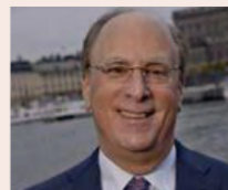
STYR. Blackrocks vd Larry Fink har deklarerat en ny hållbarhetsfilosofi för bolaget.